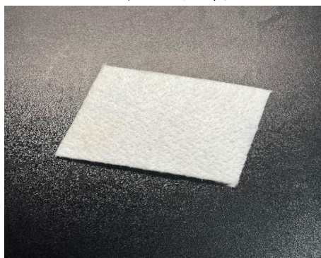
エアロジェルマット